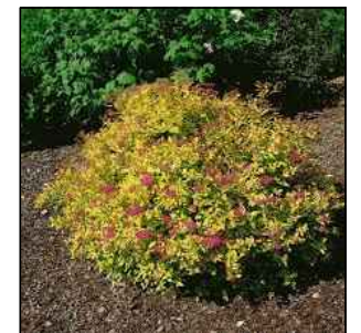
K6 - Spiraea japonica 'Golden Princess' - tavolník japonský