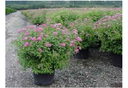
K3 - Spiraea bumalda 'Anthony Waterer' - tavolník nízký