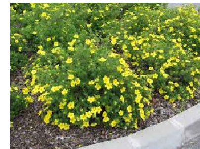
K5 - Potentilla fruticosa 'Goldteppich' - mochna křovitá