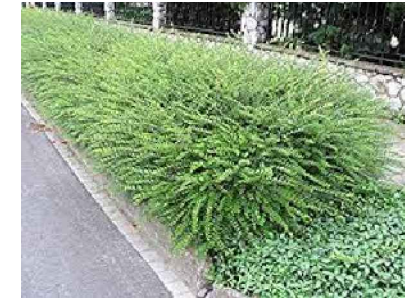
K2 - Lonicera nitida - zimolez