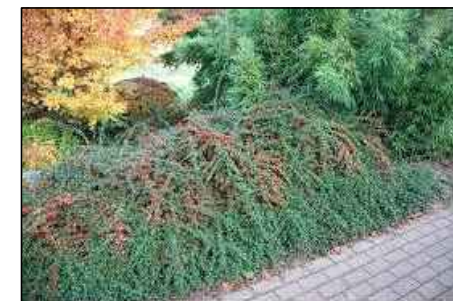
K16 - Cotoneaster x suecicus 'Coral Beauty' - skalník