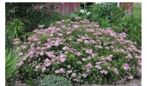
K7 - Spiraea japonica 'LITTLE Princess' - tavolník japonský