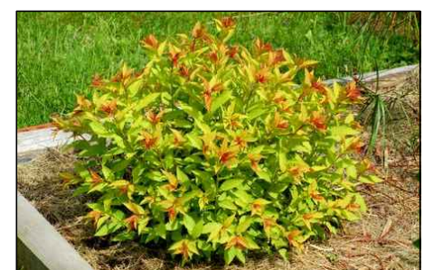
K18 - Spiraea japonica 'Goldflame' - tavolník japonský