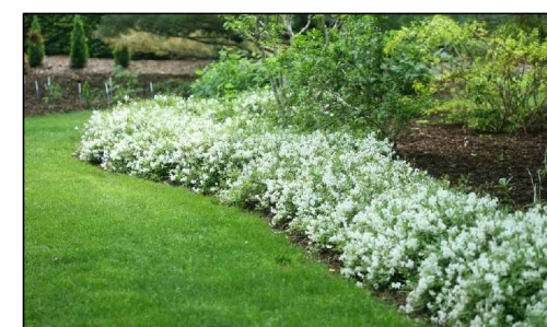
K17 - Deutzia gracilis 'Nikko' - trojpek něžný