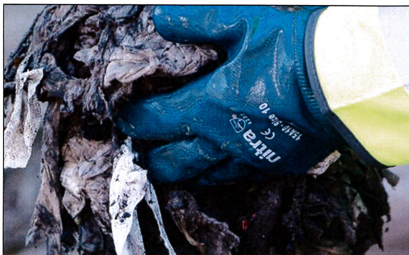
Obr. 1 a 2 – Obrovským problémem při likvidaci a dopravě odpadních vod jsou jednorázové vlhčené ubrousky. Tento materiál patří do směsného odpadu!!!