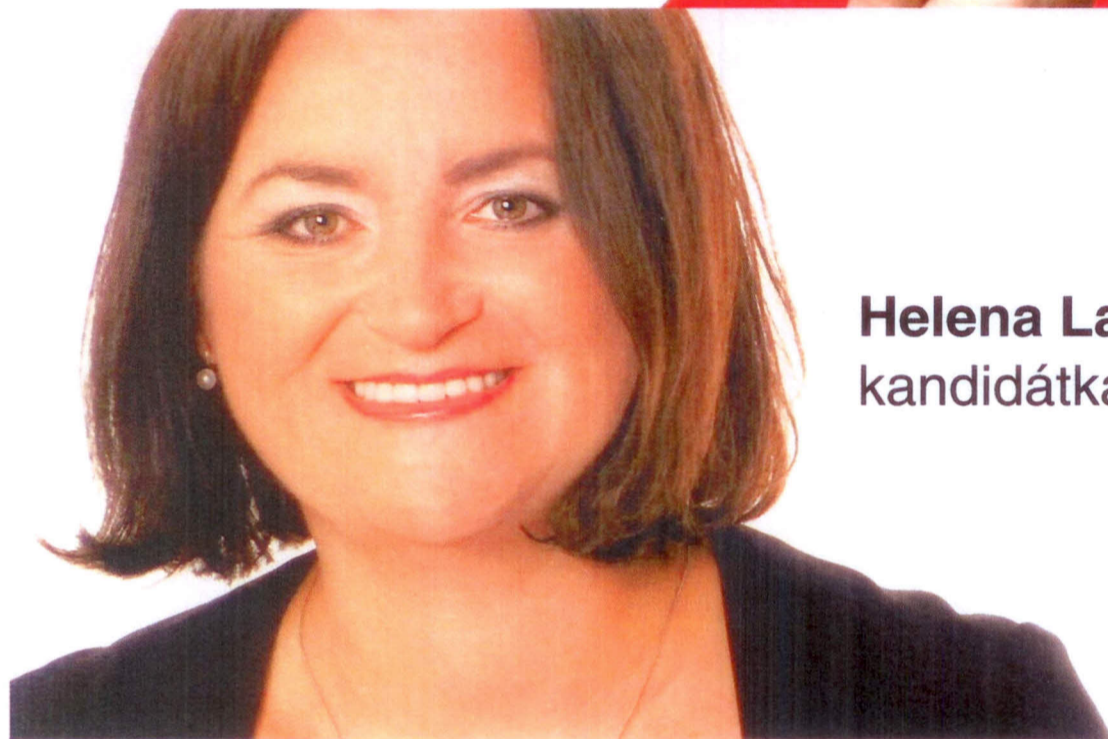
Helena Langšádlová kandidátka na hejtmanku